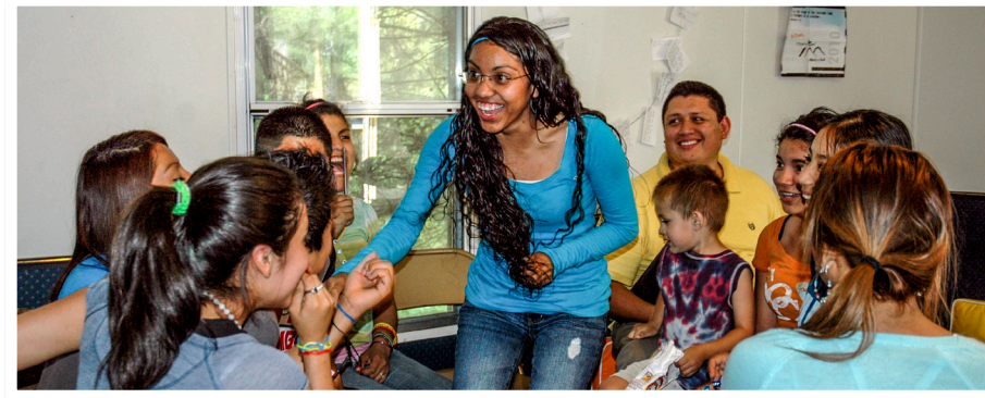
El grupo de jóvenes en Casa del Alfarero disfrutando de unos juegos juntos.

a ser una enfermera, pero había muchos obstáculos. Sus padres la trajeron a los Estados Unidos cuando ella tenía sólo dos años, por lo que ella no era candidata para recibir ayuda financiera estatal o federal u otros privilegios.