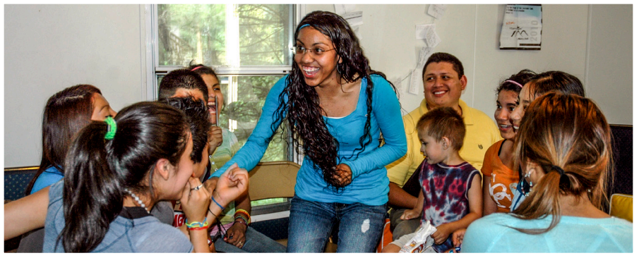
El grupo de jóvenes en Casa del Alfarero disfrutando de unos juegos juntos.

a ser una enfermera, pero había muchos obstáculos. Sus padres la trajeron a los Estados Unidos cuando ella tenía sólo dos años, por lo que ella no era candidata para recibir ayuda financiera estatal o federal u otros privilegios.